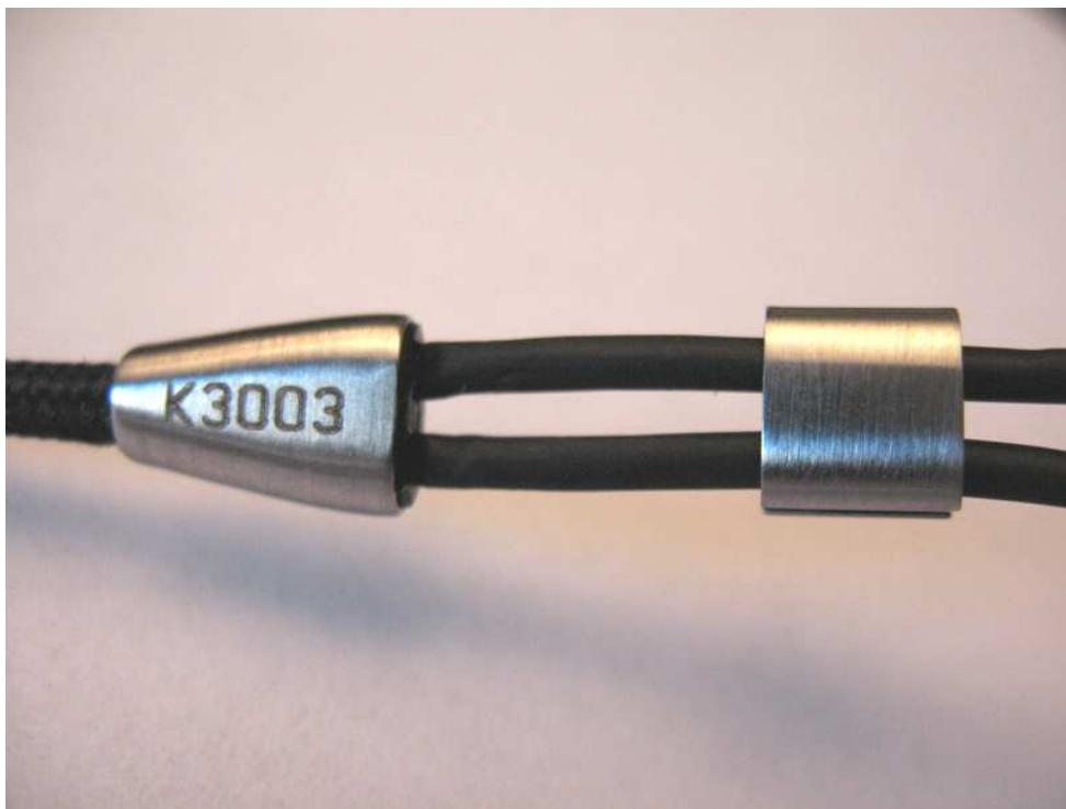
This image has been resized to fit in the page. Click to enlarge.

Avrei potuto stupirvi con effetti speciali (etc. etc.) già qualche mese fa, ma avevo le mani legate... image